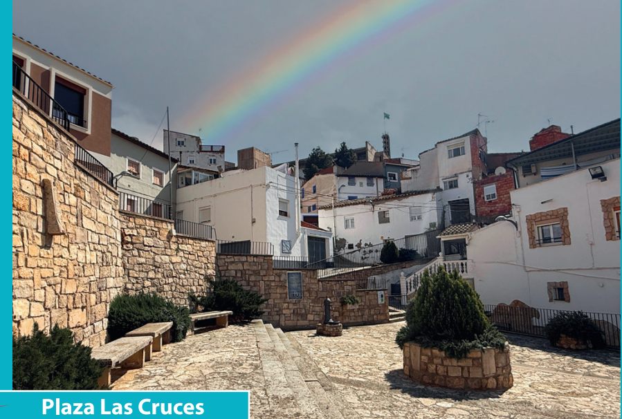
Plaza Las Cruces

1986 como Centro Cultural, alberga la Biblioteca Municipal, archivo histórico, salas de exposiciones y un museo de tradiciones fragatinas. En su interior se expone el cuadro Boda fragatina (1918), de Miguel Viladrich, obra destacada sobre la indumentaria y costumbres locales.