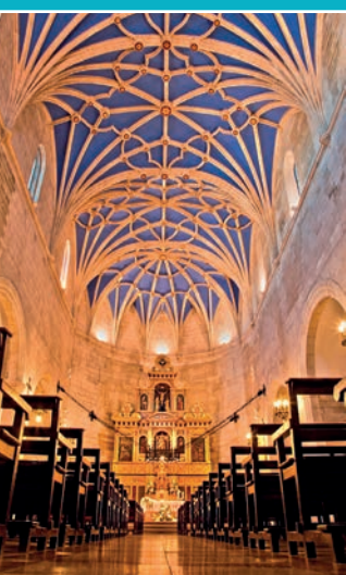
Iglesia de San Pedro