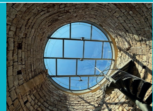
Monumento Dona de Faldetes – La Fragatina

Este impresionante depósito de piedra fue construido en el siglo XVII para almacenar nieve y hielo. Redescubierto en 2020 durante unas obras, es uno de los mejores ejemplos de arquitectura del frío.